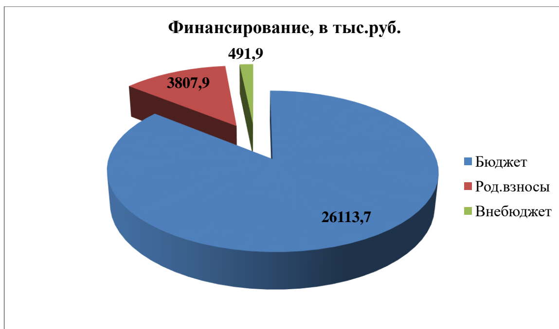
Распределение средств бюджета детского сада по источникам их получения:

Одним из важных условий для улучшения качества образовательного процесса является эффективное использование финансовых потоков. Наше образовательное учреждение финансируется из бюджетных средств города и региона, которые ежегодно выделяются на основании муниципального задания согласно плана финансово-хозяйственной деятельности, что позволяет обеспечивать стабильное функционирование и развитие.